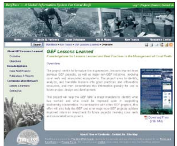
GEF Lessons Learned website