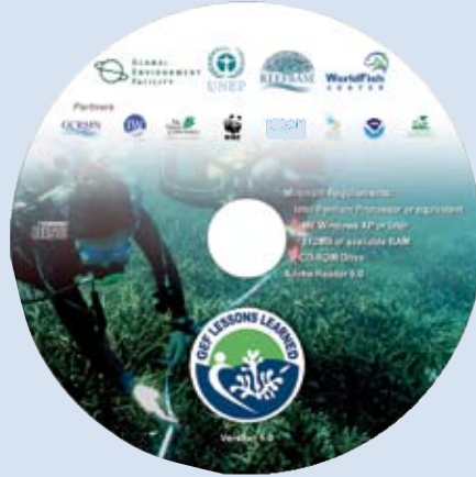
GEF Lessons Learned CD

พวกเราารู้สึกตื่นตัวมากที่จะได้เผยแพร่ แผ่น CD และเว็บไซต์นี้ หวังว่าคงจะเป็นประโยชน์แก่ท่าน ถ้าหากท่านพบว่าข้อมูลในนี้ไม่ถูกต้อง ยังไม่มีการเพิ่มเติมปรับปรุง หรือเราไม่ได้รับข้อมูลที่ควรจะรู้ กรุณาติดต่อหรือแจ้งให้เราทราบได้ทุกเมื่อที่ reefbase@cgiar.org เพื่อที่เราจะได้ปรับปรุงข้อมูลให้ทันต่อเหตุการณ์และเป็นประโยชน์แก่ท่านทั้งหลายต่อไป