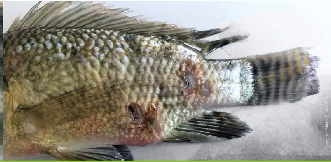
Open wounds ကိုယ်တွင်အနာဖြစ်ခြင်း