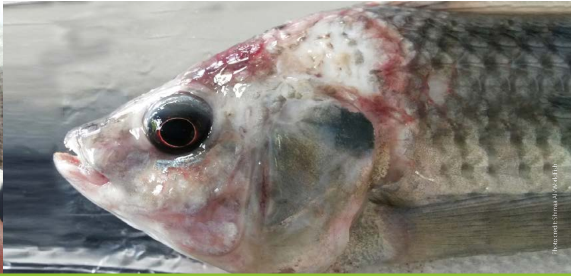
Skin discoloration အရေပြားအရောင်ပျက်ခြင်း