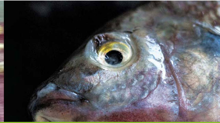
Eye endophthalmia/eye shrinkage မျက်လုံးအိမ်ကျခြင်း