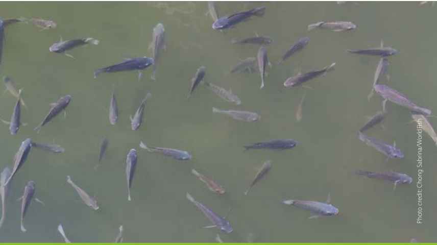
Fish lethargic at surface and not feeding ကူးစက်ခြင်းမရှိရေတွင်ပျော်နေသည်/အစာမစား

တီလာပီးယား ငါးသားဖောက်ခြင်း၊ ငါးသားပေါက်ပြုစုခြင်း၊ အသားတိုးမွေးမြူခြင်းနှင့် ရောဂါဖြစ်ပွားမှုကိုသိရှိခြင်းစသော စွမ်းရည်များတိုးတက်ရရှိစေရန် ဤပုံပြကားချပ်ပိုစတာကို ဖြန့်ချိပါသည်။ ရောဂါမဖြစ်မီ ကြိုတင်ကာကွယ်ခြင်း၊ ရောဂါကိုသိရှိရန် အမြန်စစ်ဆေးခြင်းနှင့် ဆောင်ရွက်ရန်များကို စောလျင်စွာပြုလုပ်ခြင်းစသည့် လုပ်ငန်းစဉ်များမှာ ရေနေသက်ရှိ သတ္တဝါမွေးမြူရေးဆိုင်ရာ ရောဂါထိန်းသိမ်းခြင်းအတွက် အကောင်းဆုံးနည်းလမ်းဖြစ်ပါသည်။ ထင်ရှားသော ရောဂါလက္ခဏာတွေ့ရှိခြင်း၊ ပုံမှန်ကူးစက်မှုမရှိခြင်း၊ အစာမစားခြင်း၊ အမြောက်အမြားသေဆုံးခြင်းကို တွေ့ရှိပါက နီးစပ်ရာ ငါးလုပ်ငန်းဦးစီးဌာနနှင့် ငါးရောဂါပညာရှင်များထံမှ အကူအညီတောင်းခံရန် ဖြစ်ပါသည်။