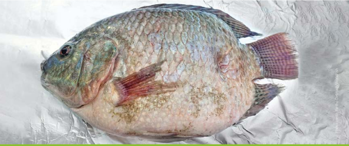
Abdominal distension/swelling ဝမ်းဗိုက်ဖောင်းခြင်း/ဖျဉ်းစွဲခြင်း