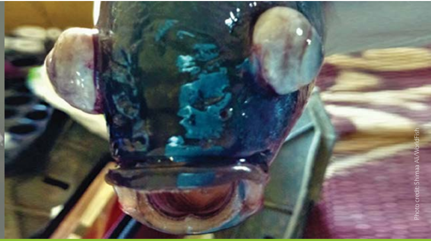
Eye exophthalmia/popeye မျက်လုံးပြူးခြင်း