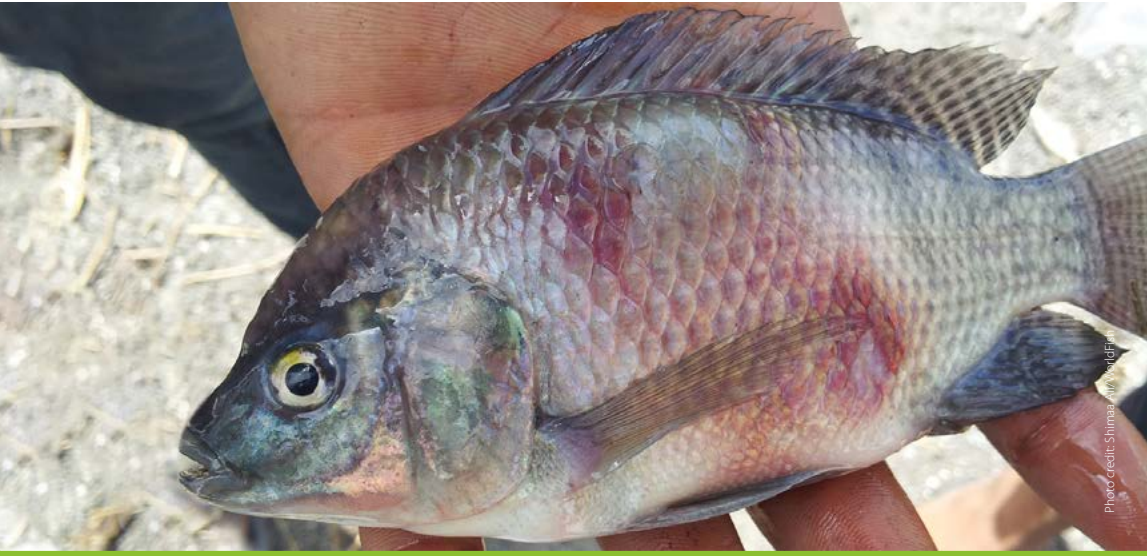
Skin erosions hemorrhagic lesion အရေပြားပျက်စီးခြင်း/သွေးခြေဥခြင်း