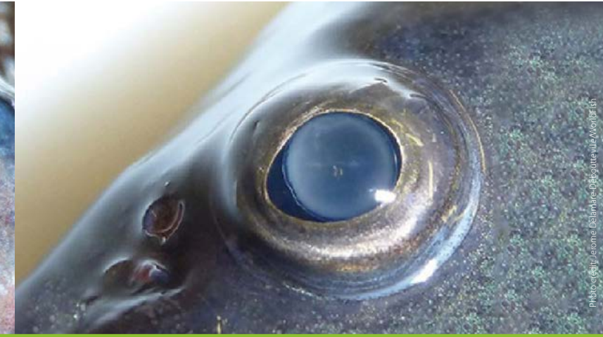
Eye opacification မျက်လုံးတိမ်စွဲခြင်း