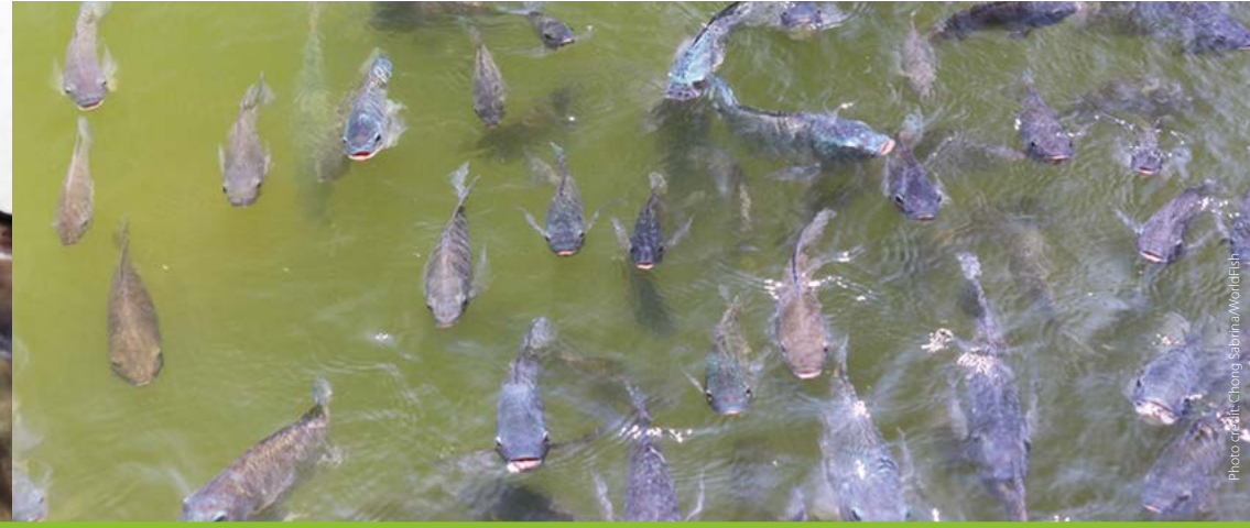
Fish gasping air at the surface ရေမျက်နှာပြင်တွင်လေရှူခြင်း