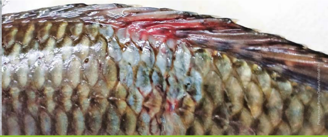
Scale protrusion/detachment အကြေးခွံများကြွတက်ခြင်း/အကြေးခွံကျွတ်ခြင်း