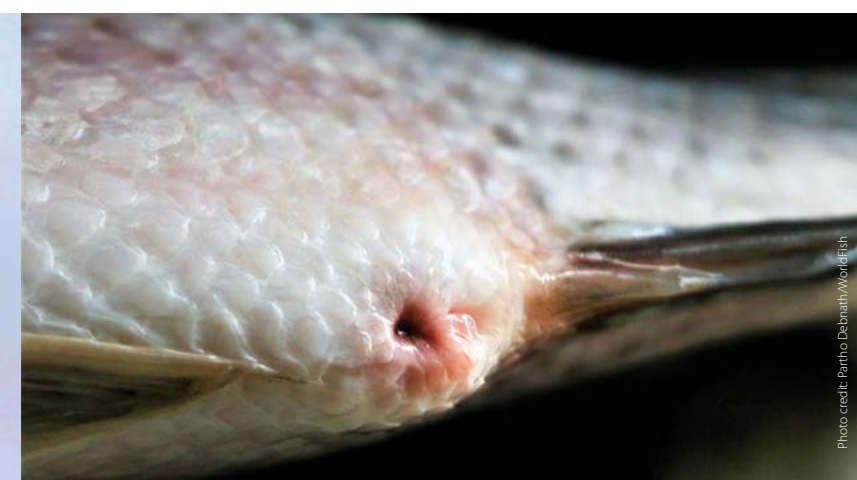
Swollen anus ဝအိုဖူးရောင်ခြင်း

This tilapia disease extension material and photographs were developed by the CGIAR Research Program on Fish Agri-Food Systems (FISH) led by WorldFish. It was produced as part of the WorldFish better management practice (BMP) resources to support sustainable and responsible tilapia farming. The translation into Myanmar language and printing of this material was done by INLAND MYSAP, which is one component of the Myanmar Sustainable Aquaculture Programme (MYSAP). This programme is funded by the European Union and the German Federal Ministry for Economic Cooperation and Development (BMZ).