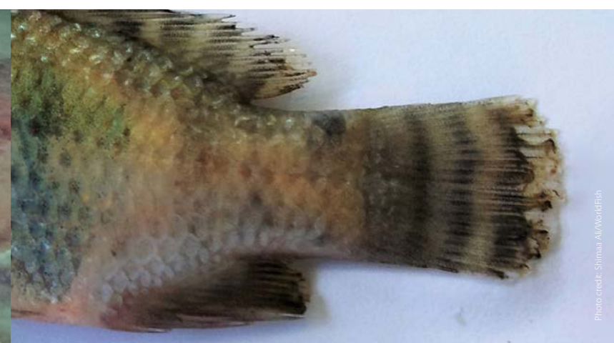
Fin rot/tail rot အတောင်ပုပ်ခြင်း/အမြီးပုပ်ခြင်း