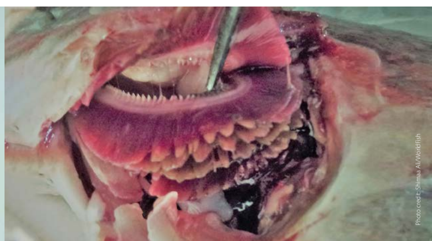
Gill rot ပါးဟက်ပုပ်ခြင်း