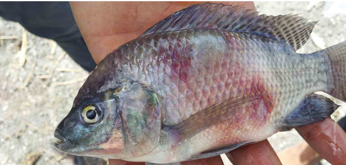
Skin erosions hemorrhagic lesion