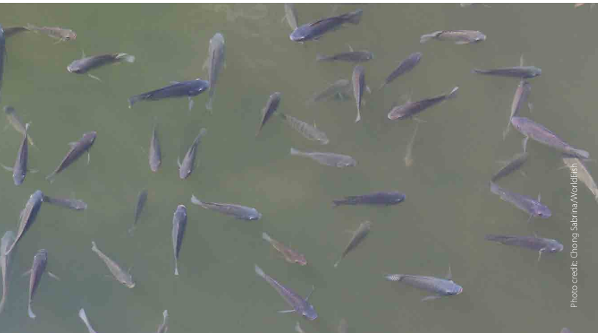
Fish lethargic at surface and not feeding

គោលបំណងនៃផ្ទាំងរូបភាពនេះគឺលើកកម្ពស់ចំណេះដឹងដល់ ស្ថានីយ៍ផលិតកូនត្រីពូជ កសិករបំប៉ន កសិករចិញ្ចឹម និងអ្នកផ្តល់សេវាកម្មផ្សព្វផ្សាយវារីវប្បកម្ម ដើម្បីយល់ដឹង និងរាយការណ៍អំពីជំងឺត្រីទីឡាព្យា ។ ការការពារ ការដឹងជាមុន រោគសញ្ញា និងការធ្វើអន្តរាគមន៍បានទាន់ពេលវេលា គឺជាជំហានដ៏សំខាន់បំផុតក្នុងការគ្រប់គ្រងជំងឺវារីវប្បកម្ម ។ ប្រសិនបើអ្នកសង្កេតឃើញមានរោគសញ្ញាណាមួយ អាកប្បកិរិយាមិនប្រក្រតី ឬត្រីស្លាប់ច្រើនខុសពីធម្មតា សូមមេត្តាទាក់ទងជំនាញផ្នែកសុខភាពវារីវប្បកម្មក្នុងមូលដ្ឋានរបស់អ្នក ដើម្បីរាយការណ៍ និងស្នើសុំការគាំទ្រ។