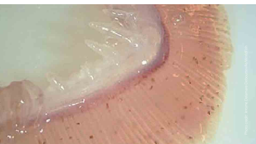
Gill paleness (anemia)

ស្រក៏ស្លេកស្លាំងដោយសារកង្វះគ្រាប់ឈាមក្រហម