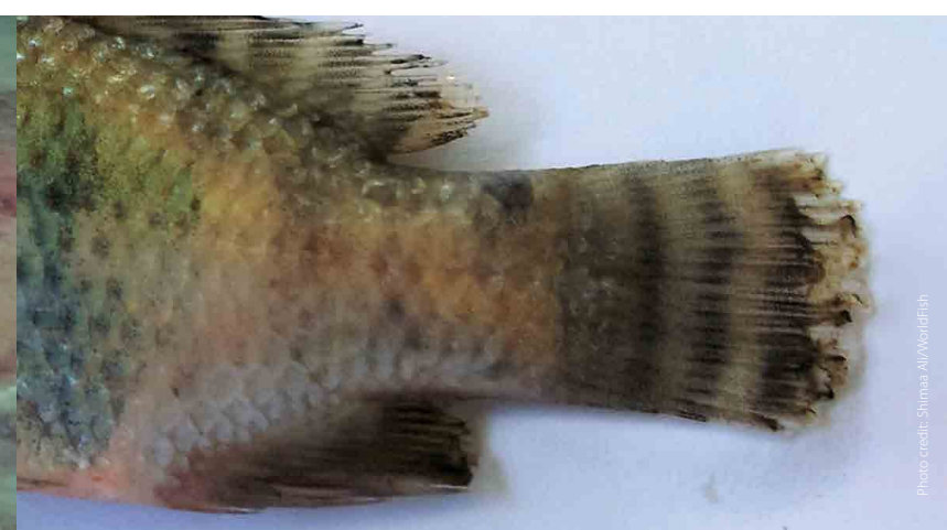
Fin rot/tail rot