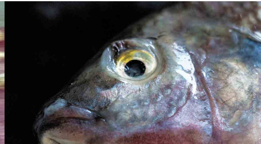
Eye endophthalmia/eye shrinkage