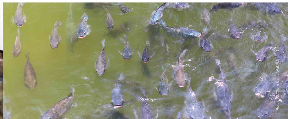
Fish gasping air at the surface