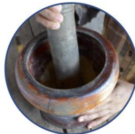
ជំហាន៤. បុកត្រីលើងរួចដោយប្រើត្បាល់ និងអង្រែ