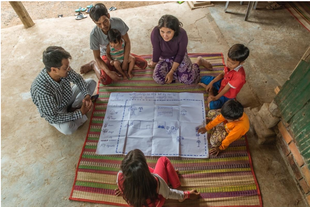
រូបថតទី ៤៖ គ្រួសារមួយពិភាក្សាគោលដៅសម្រាប់គ្រួសារខ្លួន ដោយប្រើប្រាស់ផែនទីកំណត់ចក្ខុវិស័យតាមគ្រួសារ