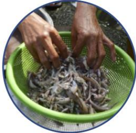
ជំហាន១. លាងត្រី ទុកត្រីឱ្យស្រស់ទឹកក្នុងកញ្ចែងមួយ