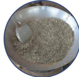
ជំហាន៣. លើងដោយប្រើកំដៅមធ្យម និងកូររហូតត្រីស្ងួត