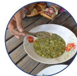
ជំហាន៦. បន្ថែមម្សៅត្រីក្នុងអាហារចម្អិនរួច មុនបរិភោគ