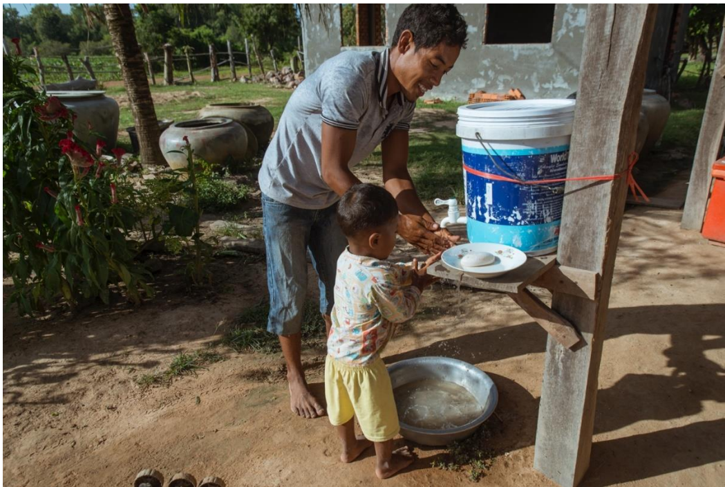
រូបថតទី ៣៖ ឪពុកលាងដៃកូនរបស់គាត់នៅកន្លែងលាងដៃក្នុងគ្រួសាររបស់ពួកគាត់។

សកម្មភាពនេះផ្តល់ការបណ្តុះបណ្តាល ការគាំទ្រ និងការកែប្រែឥរិយាបថ ដើម្បីធ្វើឱ្យប្រសើរឡើងនូវការផ្តល់អាហារបន្ថែម អាហារូបត្ថម្ភ អនាម័យ និងការរស់នៅស្អាត ដោយផ្ដោតលើស្ត្រីមានផ្ទៃពោះ និងបំបៅដោះកូន ព្រមទាំងកុមារតូចៗផងដែរ។ វគ្គបណ្តុះបណ្តាល និងការគាំទ្រនេះ ត្រូវបានធ្វើឡើងជាពិសេស ជាមួយបណ្តាអ្នកថែទាំកុមារតូចៗ និងក្រុមអ្នកថែទាំកុមារតូចៗ (ចាប់ពីកើតដល់អាយុ ៥ឆ្នាំ)។ នៅក្នុងវគ្គបណ្តុះបណ្តាលនានា អ្នកសម្របសម្រួលផ្តល់ព័ត៌មាន និងអនុវត្តបង្ហាញ អំពីការធ្វើឱ្យប្រសើរឡើងនូវការផ្តល់អាហារបន្ថែម និងការអនុវត្តលើផ្នែកអនាម័យ។ សម្រាប់ការអនុវត្តបង្ហាញ ក្រុមអ្នកថែទាំកុមារអាចប្រមូលផ្តុំគ្នា ដើម្បីចូលរួមរៀបចំអាហារដែលមានជីវជាតិ ដែលមានគ្រឿងផ្សំក្នុងមូលដ្ឋាន ដូចជា ត្រីល្អិតៗដែលសំបូរសារធាតុចិញ្ចឹម និងបន្លែដែលមានក្នុងមូលដ្ឋាន ឬដើម្បីសង្កេតមើលវិធីកែលម្អភាពស្អាត និងអនាម័យផ្ទះសំបែង។ ដើម្បីសម្រួលដល់ពេលវេលាដែលមានក្នុងកម្រិតកំណត់របស់អ្នកថែទាំកុមារ វគ្គ បណ្តុះបណ្តាលនិងការអនុវត្តបង្ហាញ មិនគួរធ្វើឡើងច្រើនជាងពីរម៉ោងឡើយ និងគួរអនុវត្ត ឬមួយនៅពេលព្រឹក ឬពេលរសៀល អាស្រ័យតាមពេលវេលាដែលពួកគាត់មាន។ បញ្ជីលម្អិតនៃប្រធានបទសម្រាប់វគ្គបណ្តុះបណ្តាល ក៏ដូចជាគំរូឧបករណ៍ និងសកម្មភាពបណ្តុះបណ្តាល មានបង្ហាញក្នុងឧបសម្ព័ន្ធ ១ ។