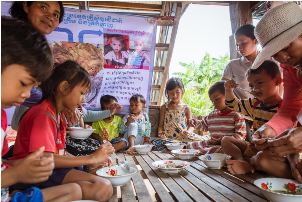
រូបថតទី ៥៖ កុមារកំពុងញ៉ាំអាហារដែលរៀបចំដោយប្រើប្រាស់ត្រីកបានក្នុងមូលដ្ឋាន នៅក្នុងពេលអនុវត្តបង្ហាញអំពីការចម្អិនអាហារ។