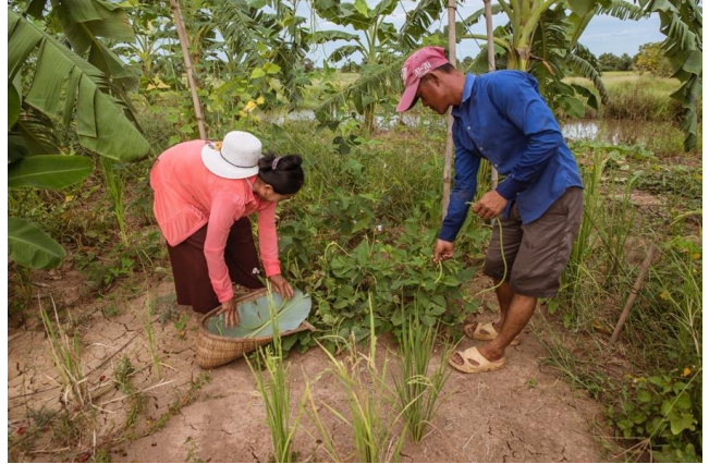
រូបថតទី ៦៖ ប្តី និងប្រពន្ធ ថែទាំច្បារដំណាំជាមួយគ្នា។

ការបង្កើតចក្ខុវិស័យតាមគ្រួសារ ជាពិសេសនៅពេលគ្រួសារទាំងមូល(ប្តីនិងប្រពន្ធ)ចូលរួមអនុវត្តលំហាត់នេះទំនងជានាំមកនូវផលវិជ្ជមាន។