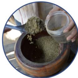
ជំហាន៥. រក្សាទុកម្សៅត្រីក្នុងកែវបិទគ្របជិតបានរហូត៤ខែ