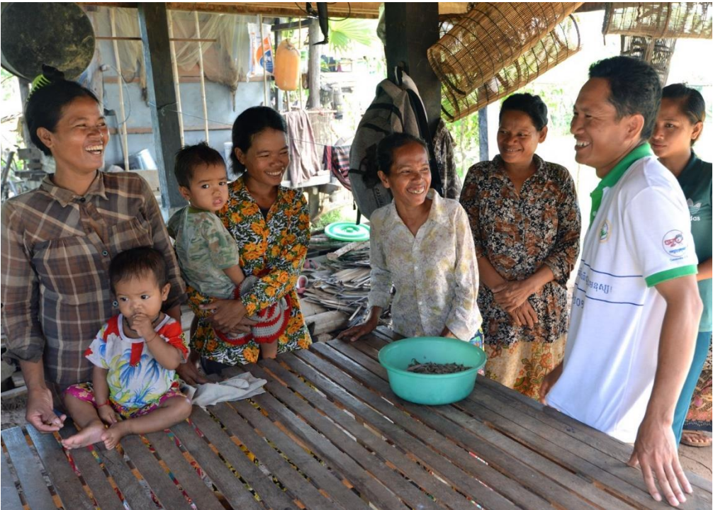
រូបថតទី ៩៖ អ្នកអនុវត្តពីអង្គការមិនមែនរដ្ឋាភិបាលក្នុងស្រុកមួយ បណ្តុះបណ្តាលអំពីអត្ថប្រយោជន៍នៃការបរិភោគត្រីល្អិតៗក្នុងមូលដ្ឋាន