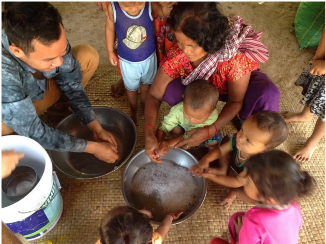
រូបថតទី ២៖ បុគ្គលិកអង្គការមិនមែនរដ្ឋាភិបាលក្នុងស្រុកមួយរូប ផ្តល់ការបណ្តុះបណ្តាលអំពីរបៀបលាងដៃ

សកម្មភាពទាំងនេះត្រូវបានធ្វើឡើងស្របគ្នា ដែលសកម្មភាពនីមួយៗជាការបំពេញបន្ថែម និងដែលរួមចំណែកជួយគ្នាទៅវិញទៅមក ដើម្បីផ្តល់នូវឥទ្ធិពល តាមរយៈទ្រឹស្តីនៃការផ្លាស់ប្តូរ (រូបទី ១)។ គេរំពឹងថាសកម្មភាពគ្រប់គ្រងជលផលតាមវាលស្រែនិងស្រះជម្រកត្រីសហគមន៍ នឹងជួយបង្កើនវត្តមានត្រី វារីសត្វដទៃទៀត និងរុក្ខជាតិទឹក និងការទទួលបានត្រី វារីសត្វដទៃទៀត និងរុក្ខជាតិទឹកទាំងនោះ សម្រាប់ការបរិភោគផងដែរ។ ចំណែកសកម្មភាពប្រាស្រ័យទាក់ទងដើម្បីកែប្រែឥរិយាបថសង្គម ដែលផ្តោតលើការលើកកម្ពស់អាហារូបត្ថម្ភ ក៏ត្រូវគេរំពឹងថា នឹងធ្វើឱ្យប្រសើរឡើងនូវការបរិភោគត្រី និងអត្ថប្រយោជន៍ខាងផ្នែកអាហារូបត្ថម្ភពីផលនេសាទផងដែរ សម្រាប់ប្រជាពលរដ្ឋក្នុងមូលដ្ឋាន ជាពិសេសសម្រាប់កុមារអាយុក្រោម ៥ឆ្នាំ តាមរយៈការបង្កើនចំណេះដឹង ការកែប្រែឥរិយាបថ និងការអនុវត្តរបស់អ្នកថែទាំក្មេង និងគ្រួសារ ជុំវិញការលើកកម្ពស់អាហារូបត្ថម្ភ និងការយកចិត្តទុកដាក់លើ WASH។ ទន្ទឹមនឹងនេះ គេក៏រំពឹងថា សកម្មភាពបង្កើនការយល់ដឹងអំពីសមភាពយេនឌ័រ នឹងរួមចំណែកបង្កើនប្រសិទ្ធភាពនៃការគ្រប់គ្រងជលផលតាមវាលស្រែ និងសហគមន៍ស្រះជម្រកត្រី ព្រមទាំង លទ្ធផលប្រសើរជាងមុនលើផ្នែកលើកកម្ពស់អាហារូបត្ថម្ភ និង WASH ផងដែរ។