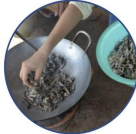
ជំហាន២. លើងត្រីដែលលាងរួចក្នុងខ្ទះមួយ