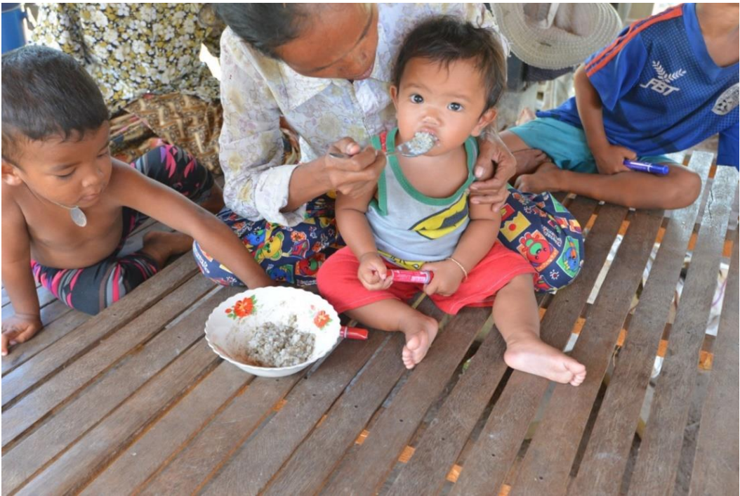
រូបថតទី ១៖ ម្តាយកំពុងបញ្ជាក់បបដល់កូន ដែលចំអិនលាយជាមួយត្រីដែលជាប្រភេទរកបានក្នុងមូលដ្ឋាន។