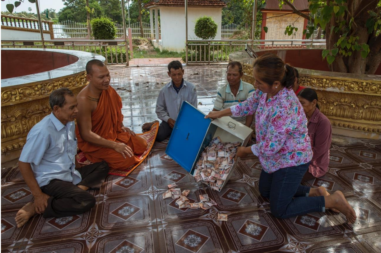
រូបថតទី ៨៖ ស្ត្រីសមាជិកគណៈកម្មការ CFR មួយរូប ដែលគ្រប់គ្រង និងដឹកនាំការកៀរគរមូលនិធិសម្រាប់ CFR របស់ពួកគាត់