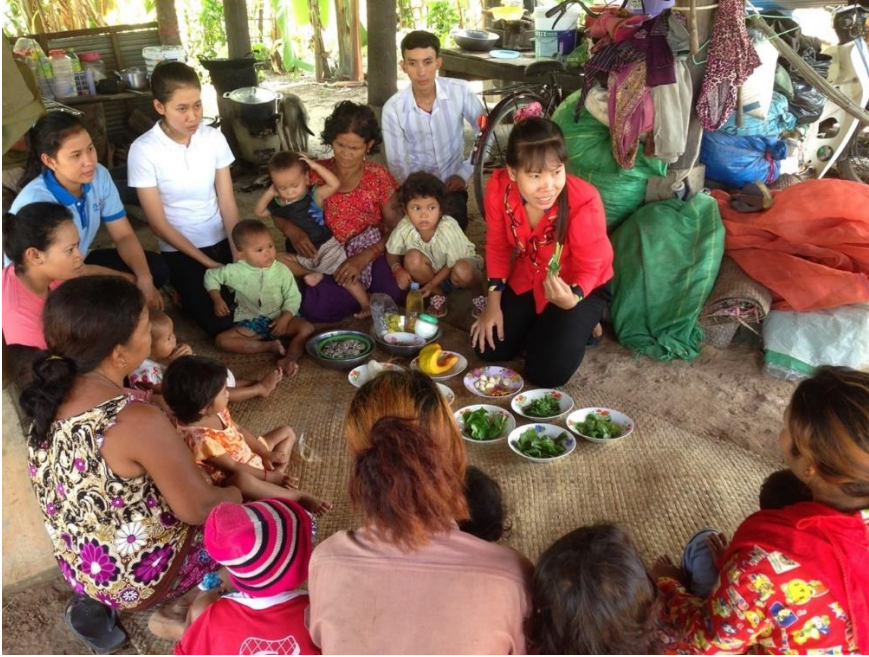
រូបថតទី ៧៖ អ្នកអនុវត្តម្នាក់មកពីអង្គការមិនមែនរដ្ឋាភិបាល ណែនាំពីសកម្មភាពការចម្អិនអាហារ ដោយប្រើប្រាស់ត្រី និងបន្លែចម្រុះ