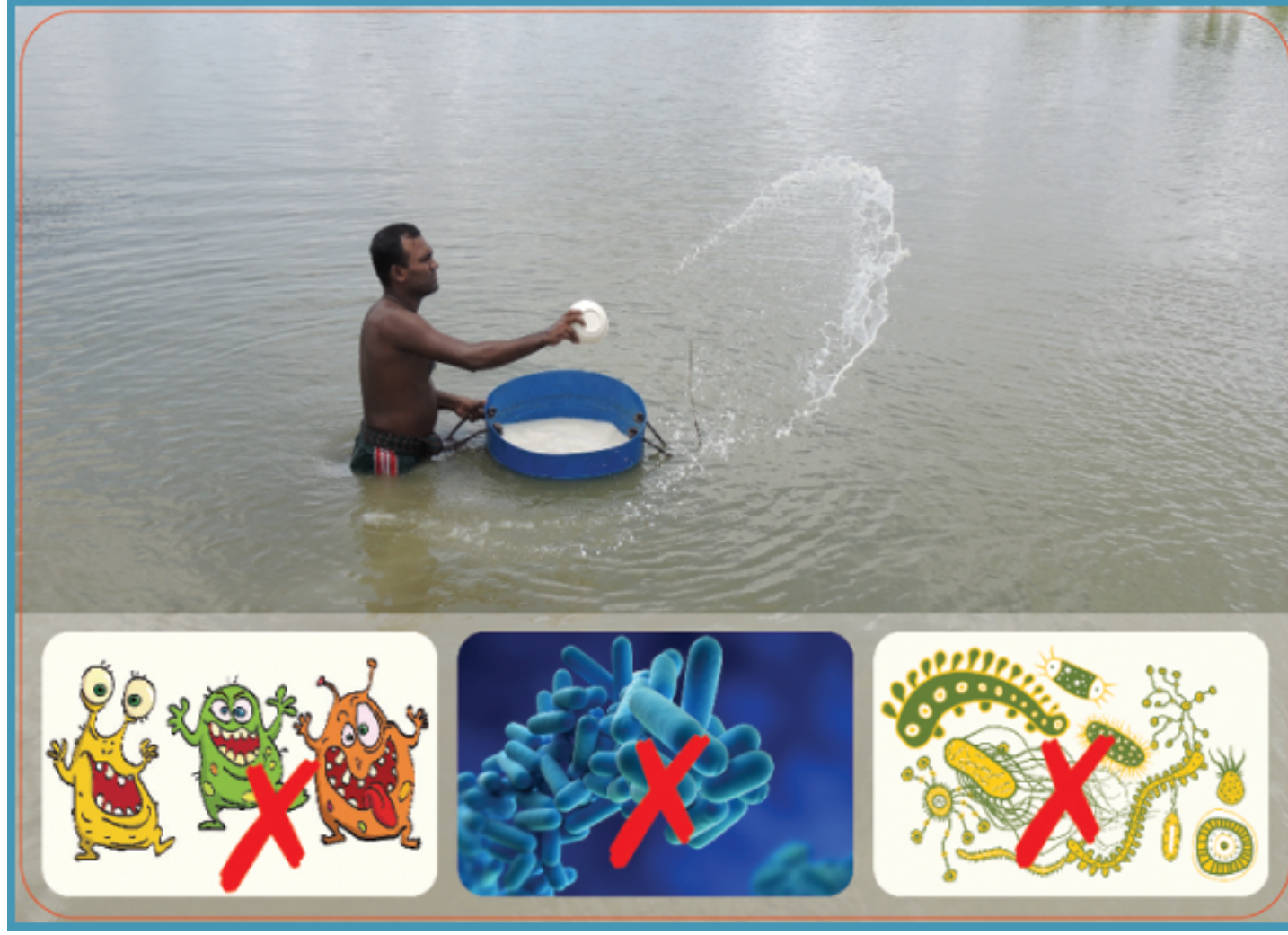
চুন রোগজীবাণু ধ্বংস করে