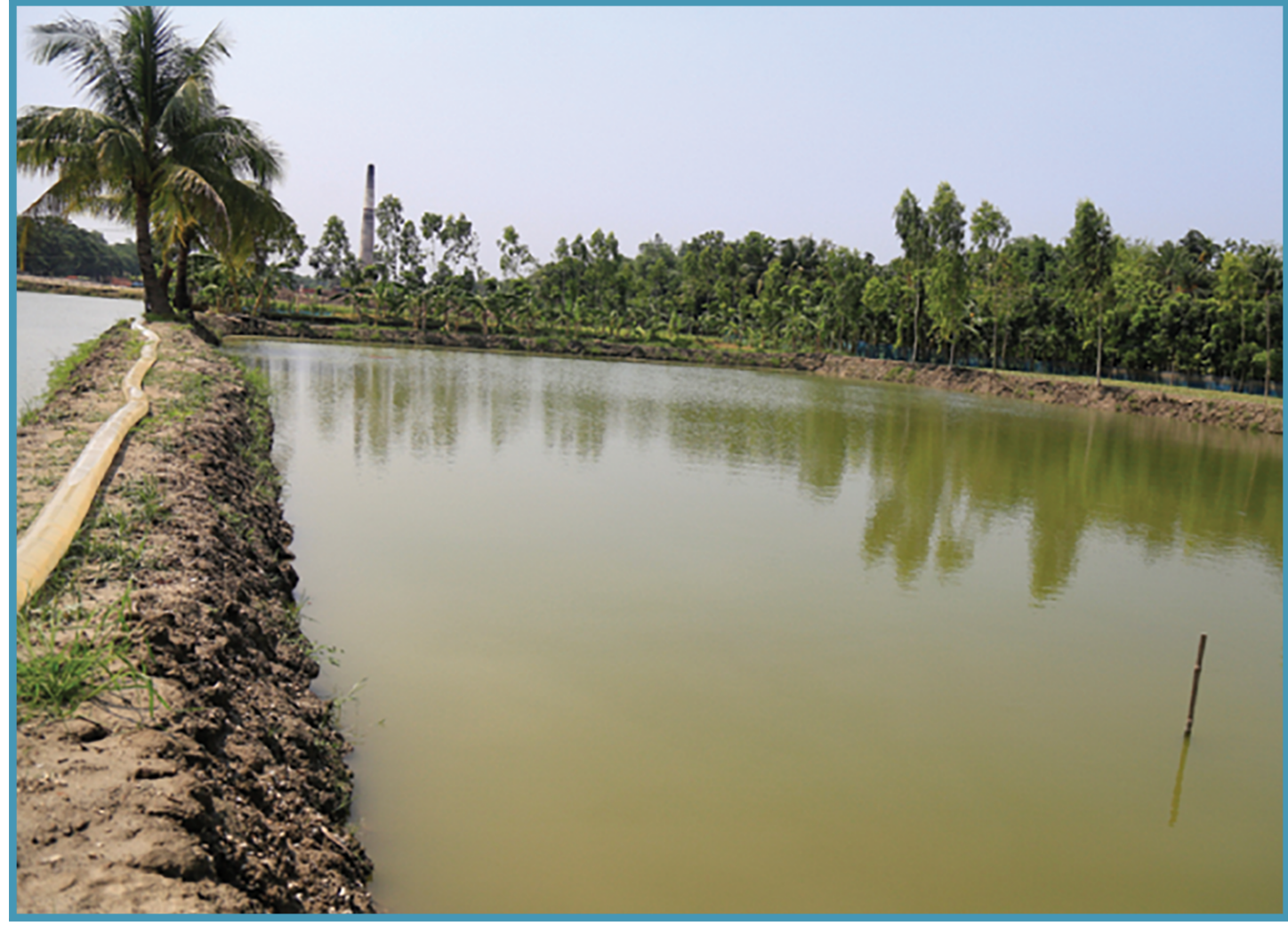
চুন পুকুরের পানির মান উন্নত করে