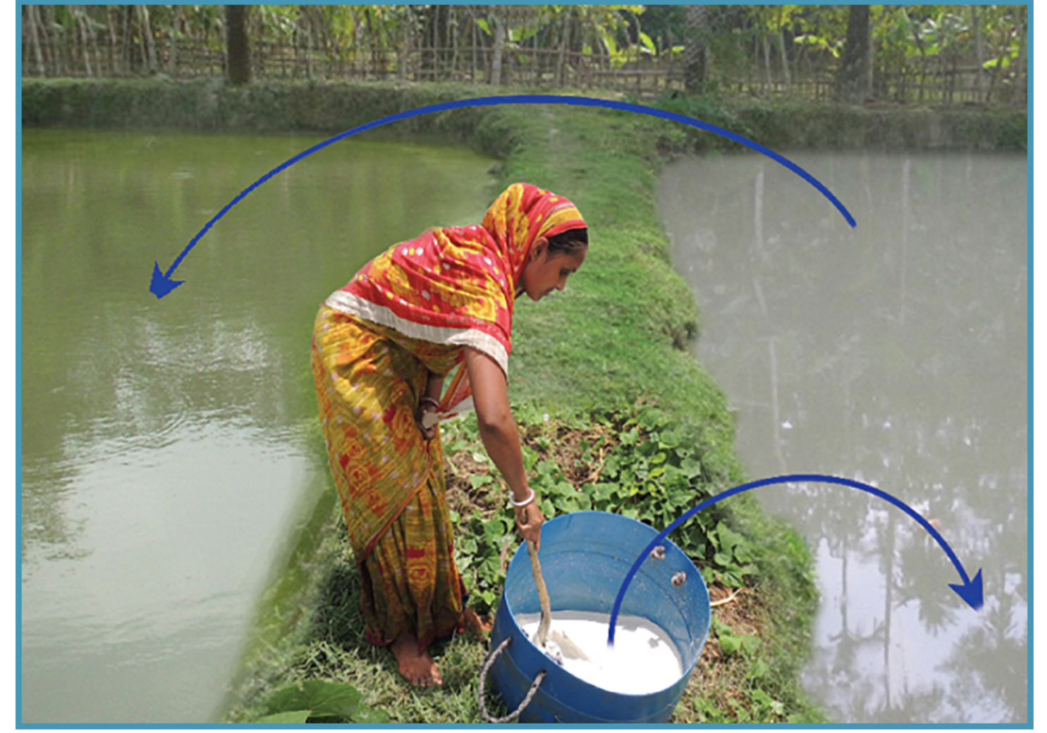
চুন পানির ঘোলাত্ব দূর করে