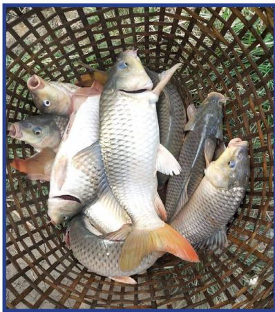
ကျိုင်းတုံ စပါး-ငါး ရှေ့ပြေးစမ်းသပ်စိုက်ခင်းမှ မွေးမြူထုတ်လုပ်သည့် ရွှေဝါငါးကြင်း

ငါးမွေးမြူသည့်အချိန် တစ်နှစ်ပြည့်သောအခါ ပျမ်းမျှအားဖြင့် GIFT တီလားပီးယားသည် ၃၁၀ ဂရမ် (၁၉.၄ ကျပ်သား)၊ ရွှေဝါငါးကြင်းသည် ၁,၃၇၁ ဂရမ် (၈၅.၇ ကျပ်သား) အထိကြီးထွားပါသည်။ တစ်နှစ်အတွင်း ရှင်သန်နှုန်းအနေဖြင့် GIFT တီလားပီးယားမှာ ၇၇%၊ ရွှေဝါငါးကြင်းမှာ ၇၉% ရှိပါသည်။